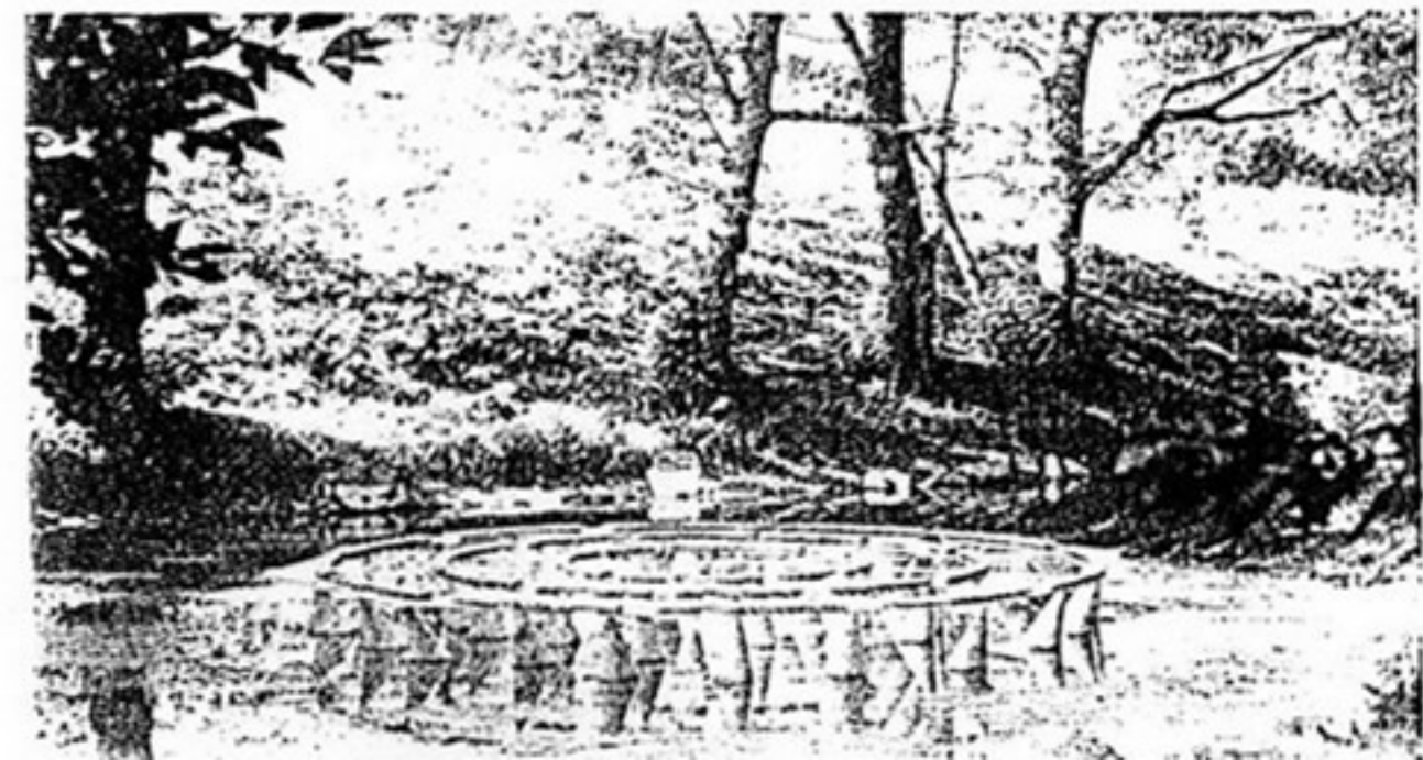
Michel Gerard: "Cellsmic", 1990-92 (bronze, glass, aluminium) Michel Gerard: "Cellsmic", 1990-92 (bronzo, vetro, alluminio).