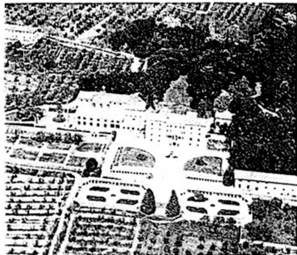
Aerial view of the Cella Farm, Santomato Pistoia. Veduta aerea della Fattoria di Celle, Santomato Pistoia.